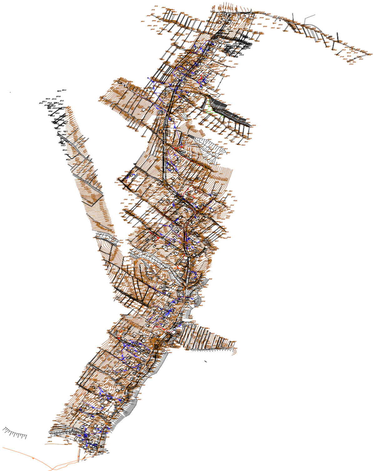
Mapa Ewidencyjna obr. Mutne Skala 1:5000

Mapa obszaru zdegradowanego i obszaru rewitalizacji na terenie wiejskim Gminy Jeleśnia